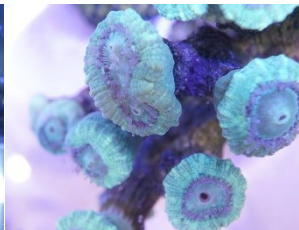
mit teilweise geöffneten Polypen