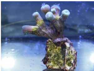
Ableger Caulastrea furcata

Die Gattung Caulastrea umfasst 5 Arten und lebt im Roten Meer und Indopazifik. Je nach Art erstreckt sich ihr Verbreitungsgebiet von Mozambique über die Seychellen und Malediven bis in den zentralen Pazifik und von Nordaustralien bis nach Süd-Japan.